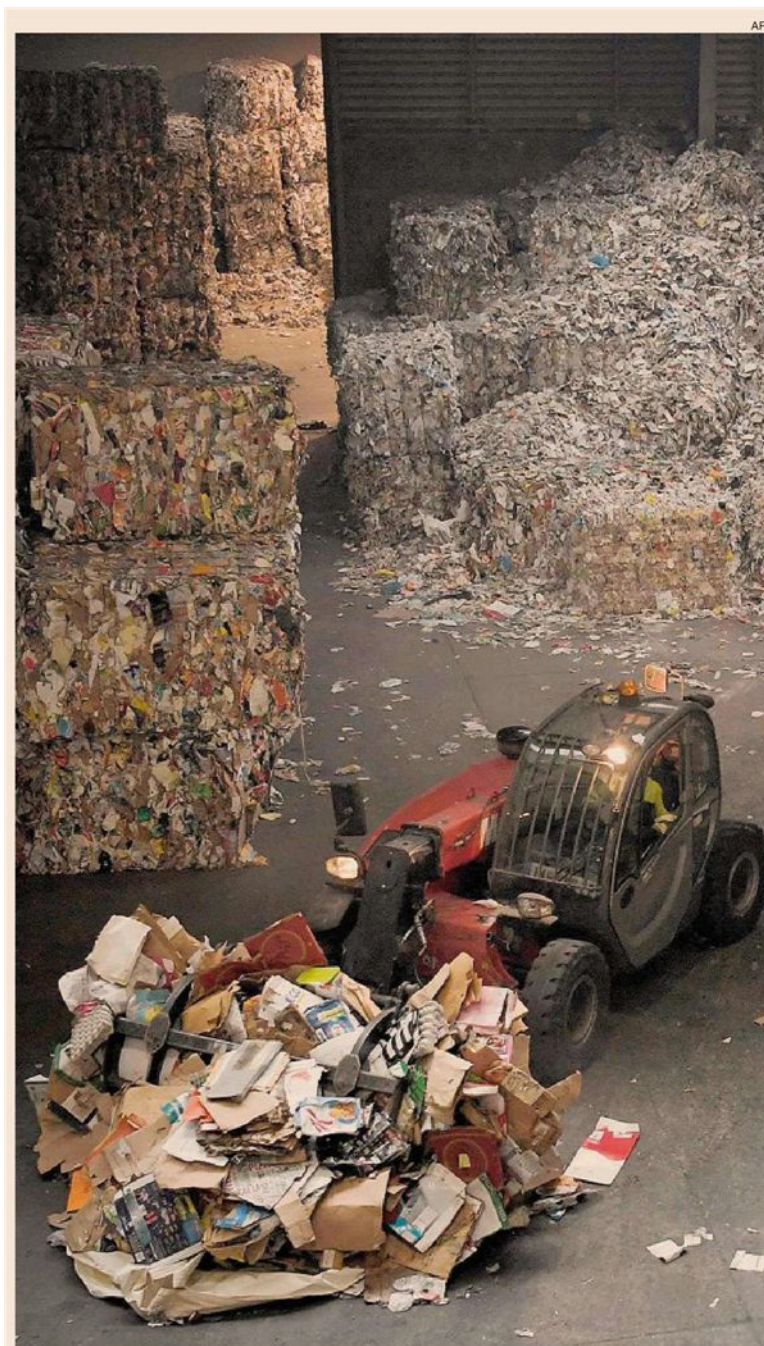
Economia circolare. Appello delle imprese al Governo per sbloccare il riciclo