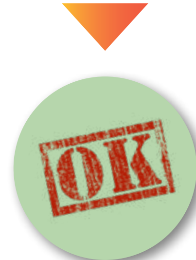
AUTORIZZAZIONI E MODIFICHE