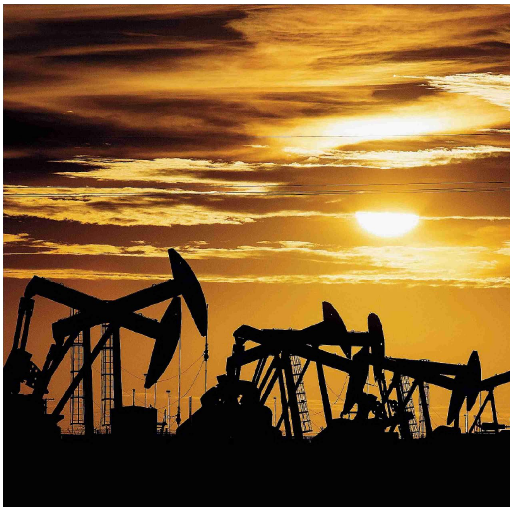
Grazie alle transizioni energetiche, tra il 1860 e la metà del 1990, a livello mondiale, l'intensità carbonica dell'energia primaria è calata dello 0,3 per cento ogni anno

Disaccoppiare crescita economica e consumo di risorse. Il passe-partout è l'innovazione tecnologica